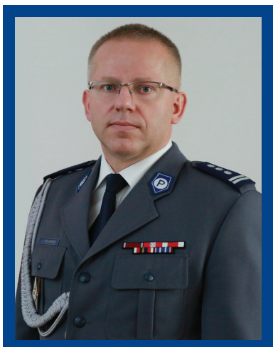
insp. Cezary Popławski Zastępca Komendanta Głównego Policji

Policja jest organizacją uczącą się. Tak jak każdy człowiek, nawet dojrzały, uczy się i kształci całe życie, tak również Policja stale musi doskonalić metody swego działania. Bez wątplenia Policja jest formacją nowoczesną, nie tylko w aspekcie technicznym czy informatycznym, ale przede wszystkim nowoczesną w sposobie myślenia. Stąd też spojrzenie w stronę świata nauki, szczególnie dyscyplin