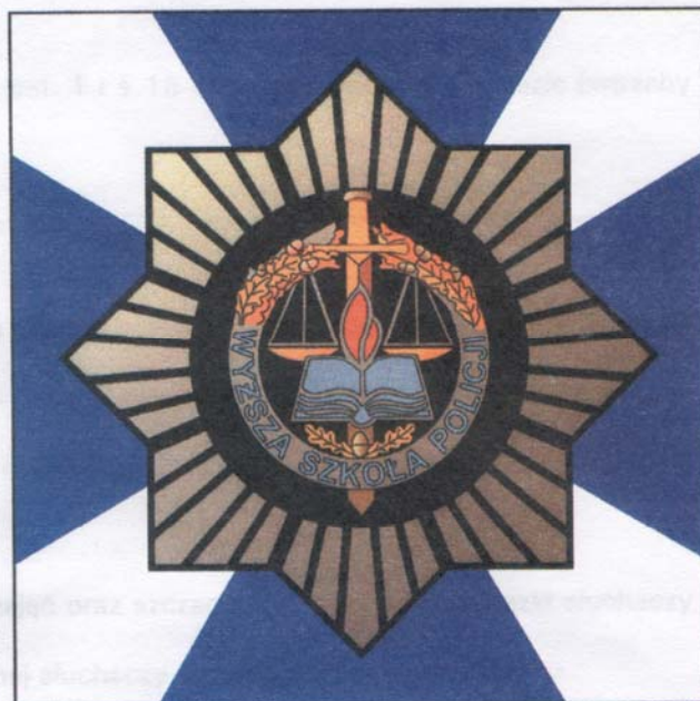
Załącznik nr 2