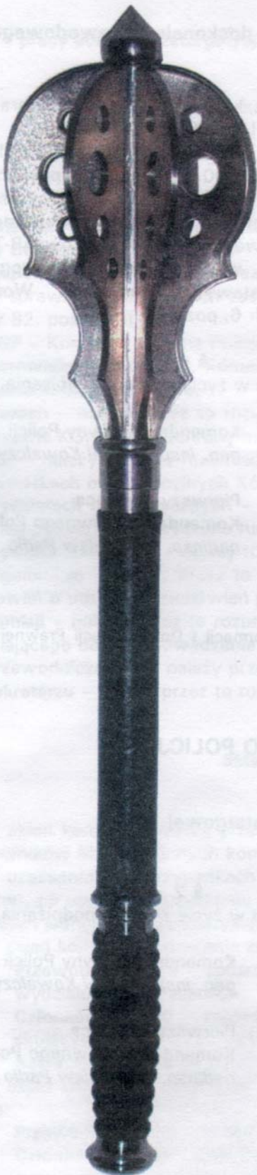
Załącznik nr 3