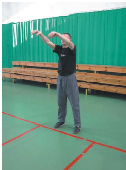
Fot. 2. Pozycja po rzucie piłką lekarską – stopy przed linią