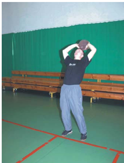
Fot. 1. Pozycja wyjściowa do próby – rzut piłką lekarską

Ocena: ćwiczący wykonuje dwa rzuty – lepszy uznaje się za wynik próby. Wynik podaje się z dokładnością do 0,5 m (na niekorzyść ćwiczącego – np. rzut w przedziale 7,0 m – 7,49 m zapisujemy jako, 7,0 m; w przedziale 7,5 – 7,99 m jako 7,5 m).