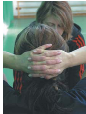
Fot. 4. Prawidłowe ułożenie rąk na głowie w próbie – siady z leżenia