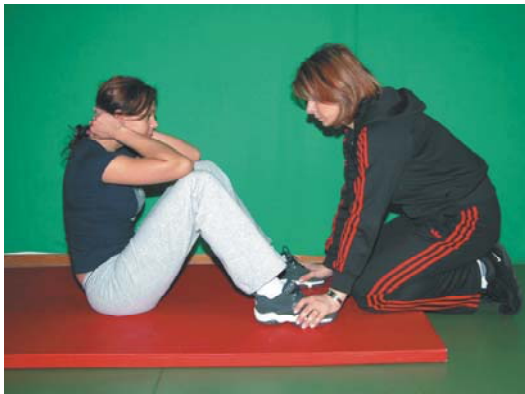
Fot. 5. Prawidłowy siad z leżenia