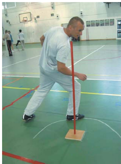
Fot. 9. Bieg ze zmianą kierunku „koperta”