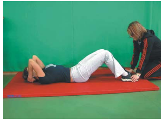
Fot. 6. Powrót do leżenia po siadzie – splecione palce rąk mają kontakt z podłożem