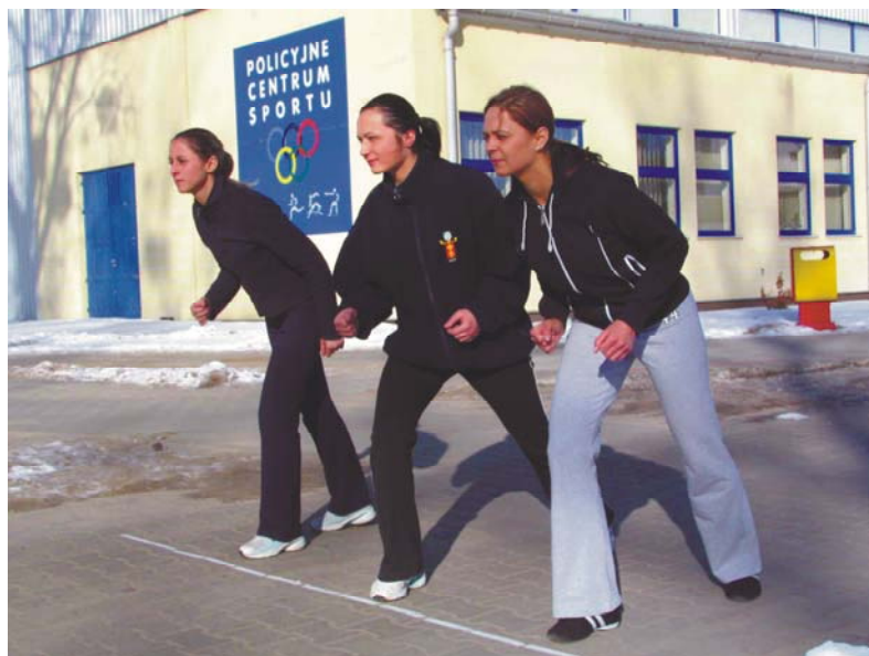
Fot. 10. Start do biegu na 800 m – kobiety, 1000 m – mężczyźni