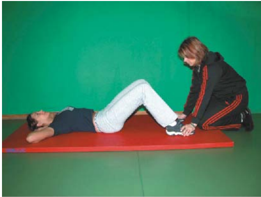
Fot. 3. Pozycja wyjściowa w próbie – siady z leżenia