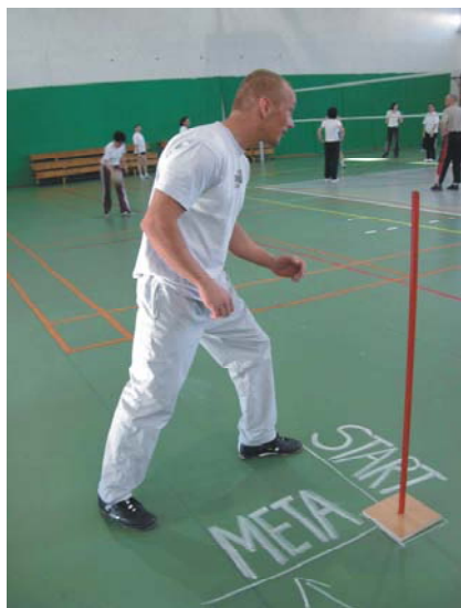
Fot. 8. Start do próby – bieg ze zmianą kierunku „koperta”

Sprzęt i pomoce: pięć stojaków o wysokości minimum 160 cm, gwizdek, stoper, taśma miernicza, kreda. Trasa biegu, linia startu i mety oraz obrys podstawy stojaków powinny być oznaczone za pomocą kredy (fot. 7).