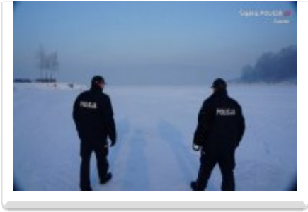
KWP w Gorzowie Wlkp.