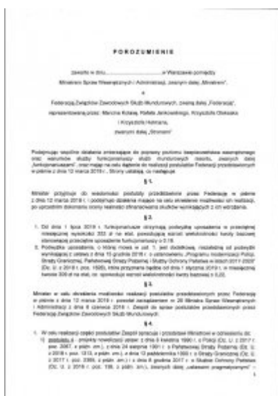
Propozycje MSWiA dla funkcjonariuszy – pełna treść projektu porozumienia