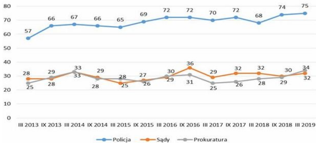
Wykres nr 4. Jak by Pan(i) ocenił(a) działalność Policji, sądów i prokuratury? (% dobrych ocen od marca 2013 r. do marca 2019 r.)