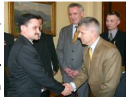
uroczystość wręczenia nagród 2