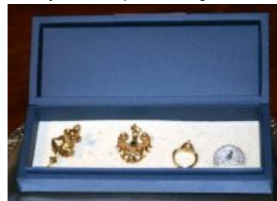
uroczystość wręczenia nagród 4