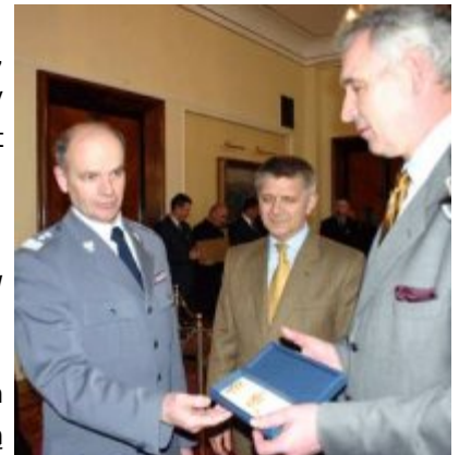
uroczystość wręczenia nagród 1

Były to właśnie brakujące elementy korony królewskiej z tzw. Skarbu Tysiąclecia,