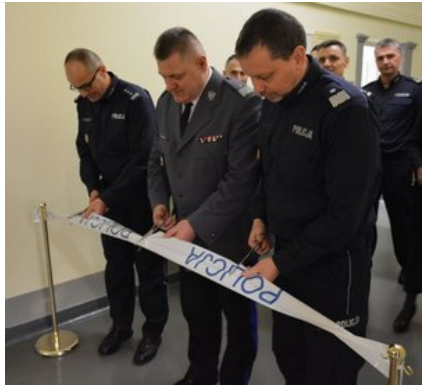
Otwarcie nowych pracowni laboratoryjnych