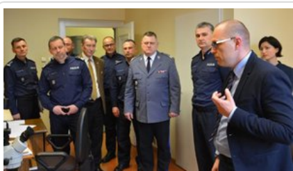
Otwarcie nowych pracowni laboratoryjnych