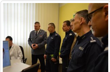
Otwarcie nowych pracowni laboratoryjnych