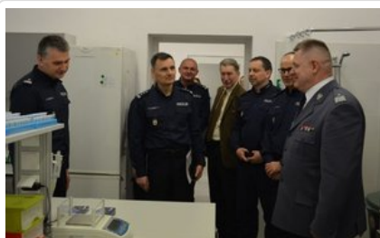
Otwarcie nowych pracowni laboratoryjnych