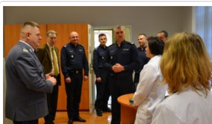
Otwarcie nowych pracowni laboratoryjnych