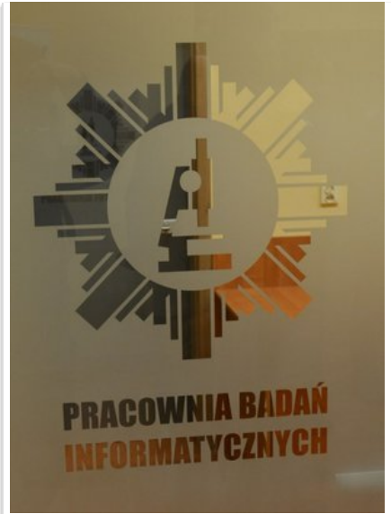
Otwarcie nowych pracowni laboratoryjnych