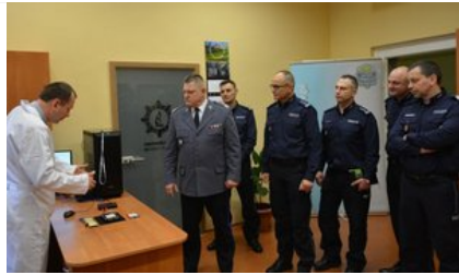
Otwarcie nowych pracowni laboratoryjnych