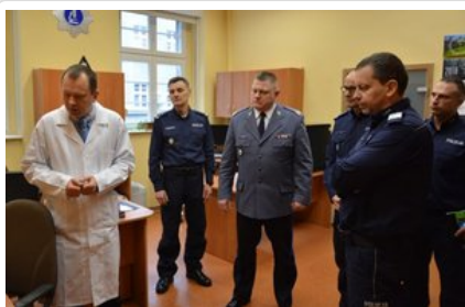
Otwarcie nowych pracowni laboratoryjnych