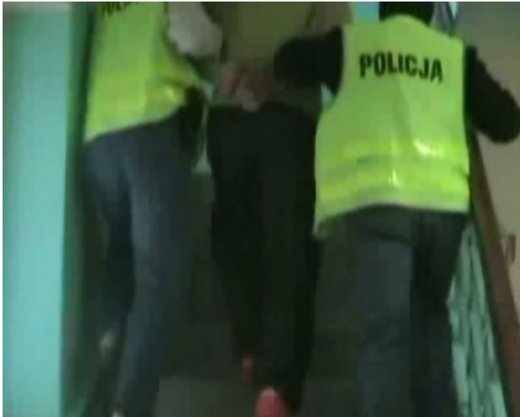
Film w formacie nieobsługiwany przez odtwarzacz. Pobierz plik Przewoził ponad 1 kg amfetaminy (format flv - rozmiar 943.23 KB)