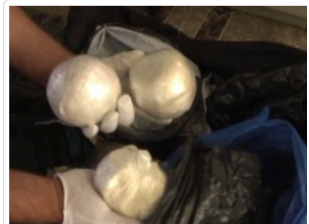
Narkotyki zabezpieczone w Gdańsku