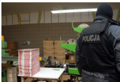
Podczas likwidacji fabryki papierosów w Katowicach

Prawie 100 tysięcy zarzutów karnych dla 34 tysięcy podejrzanych. Likwidacja 129 laboratoriów narkotyków. Na rynek nie trafia ponad 3 tony narkotyków. Zabezpieczone mienie ma wartość ponad 1,7 mld zł. Oto najkrótsza charakterystyka 9 lat skuteczności Centralnego Biura Śledczego KGP.