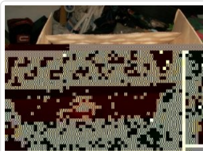
Zabezpieczone materiały wybuchowe w Radomiu