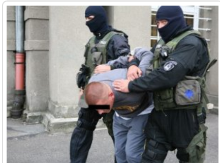
Zatrzymanie w Siedlcach