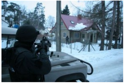
Podczas jednej z akcji