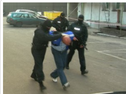
Zatrzymanie w Łodzi