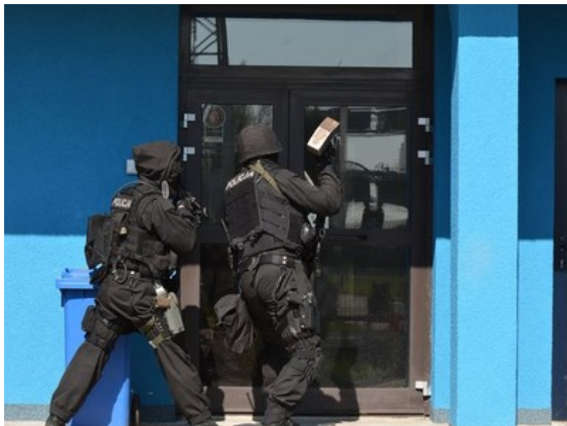
Film w formacie nieobsługiwany przez odtwarzacz. Pobierz plik Ćwiczenia policyjnych antyterrorystów (format flv - rozmiar 8.79 MB)