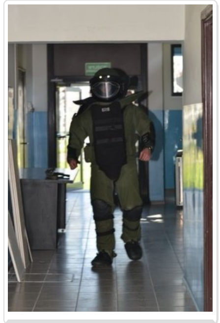
Film Ćwiczenia policyjnych antyterrorystów